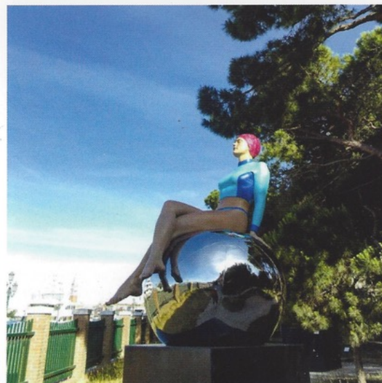
BIBI ON THE BALL

important art collections in the world, both public and private, including those of the Emperor of Japan and the Clintons.