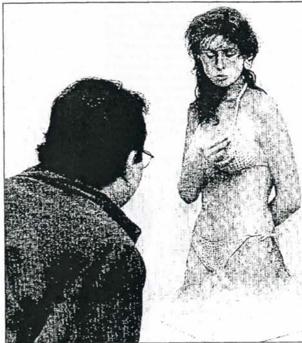
La exposición incluye 120 obras de más de ochenta creadores

Tanto es así que en la organización de la muestra no sólo ha participado el Ayuntamiento coruñés, sino instituciones como la embajada de Estados Unidos, empresas co-