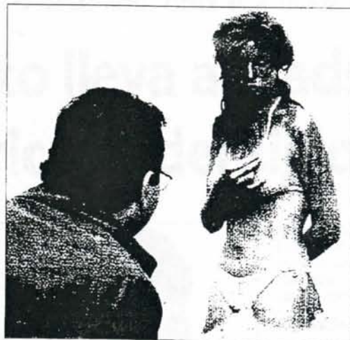
Un visitante observa una de las piezas de la exposición.

Alrededor de 120 obras de más de ochenta creadores forman una exposición digna de un museo de arte contemporáneo, para cuya organización ha sido necesaria la colabora-