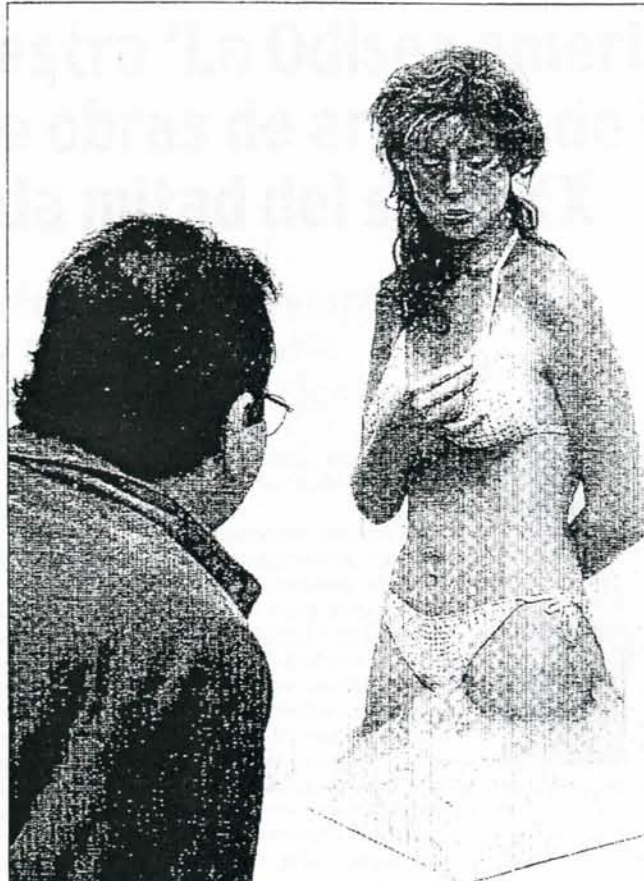
Fundación Salamanca, con el arte contemporáneo. Alrededor de 120 obras de más de ochenta creadores forman la exposición de arte contemporáneo "La Odisea Americana (1945-1980)" en el Círculo de Bellas Artes de Madrid, para cuya organización ha sido necesaria la colaboración de varias instituciones como Fundación Salamanca Ciudad de Cultura.