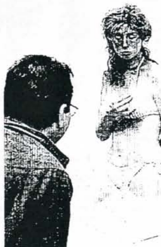
Una pieza americana.

Otra exposición se celebra en la Sala de Exposiciones de la Fundación Mapfre Vida en Madrid hasta el 6 de junio. Se trata de la antológica más completa del artista ruso Serge Charchoune desde la que realizara el Musée National d'Art de París hace más de 30 años.