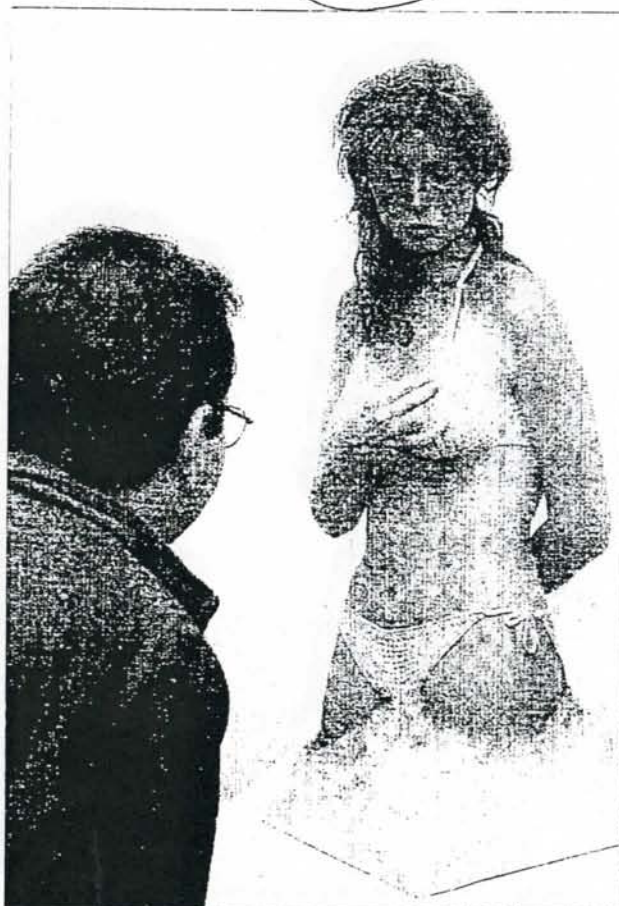
Un visitante mira con curiosidad una de las piezas de la exposición.

SERIE DE INTERCAMBIOS. En La odisea americana estos reexaminan los movimientos artísticos como una serie de intercambios que expresan la que llaman «la crisis del modernismo», un término aplicado en este caso a la realidad artística norteamericana de los años 50-80, en continua búsqueda de lo moderno, así como las estrategias y medios con los que ar-