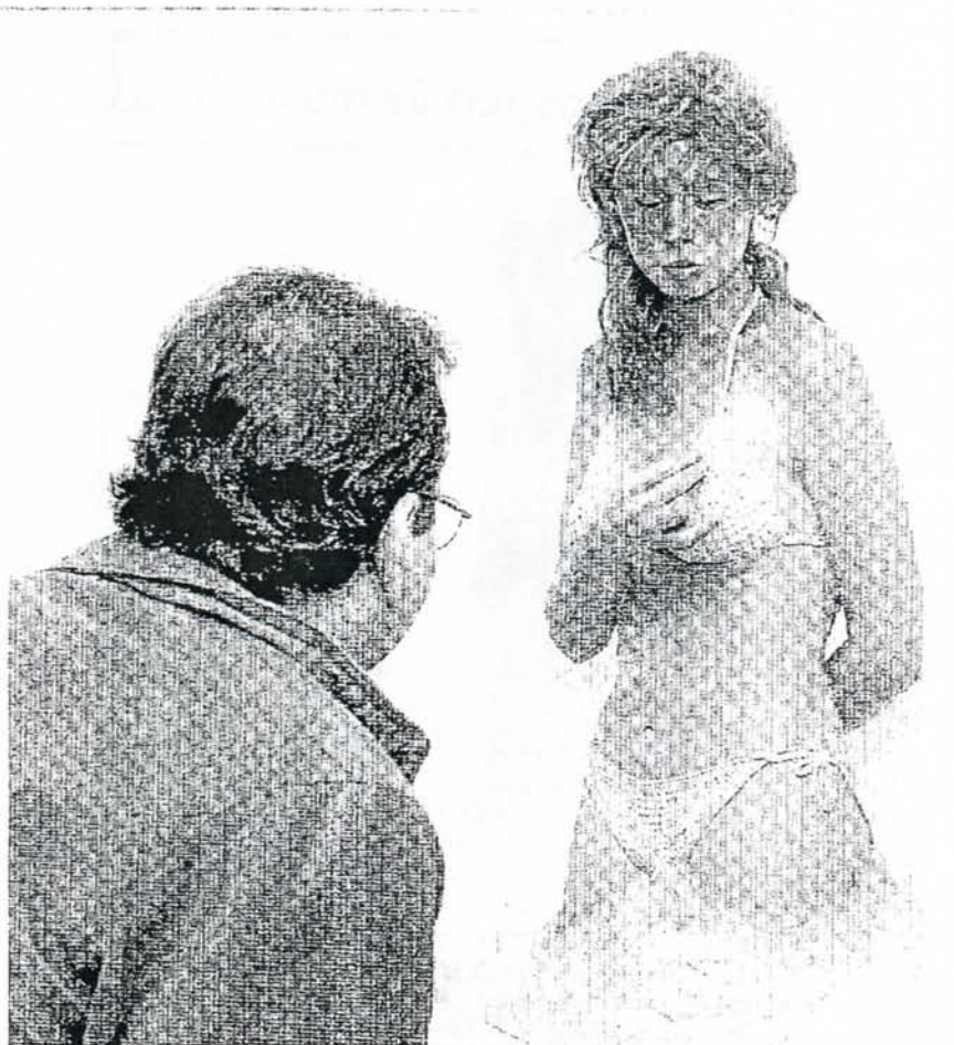
Un visitante mira con curiosidad una de las piezas que conforman la exposición "La Odisea Americana", que reúne más de un centenar de obras presentadas ayer en el Círculo de Bellas Artes de Madrid.