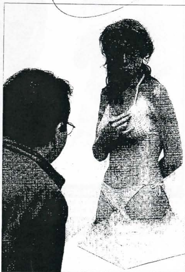
Un visitante mira con curiosidad una de las piezas de la exposición.

SERIE DE INTERCAMBIOS. En La odisea americana estos reexaminan los movimientos artísticos como una serie de intercambios que expresan la que llaman «la crisis del modernismo», un término aplicado en este caso a la realidad artística norteamericana de los años 50-80, en continua búsqueda de lo moderno, así como las estrategias y medios con los que ar-