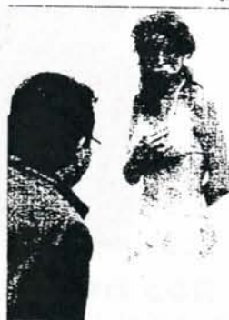
►► Una obra de la muestra.

ción con Fundación Bancaja, Fundación Salamanca Ciudad de Cultura, Ayuntamiento de A Coruña, Queensborough Community College Art Gallery y la Embajada de los Estados Unidos.