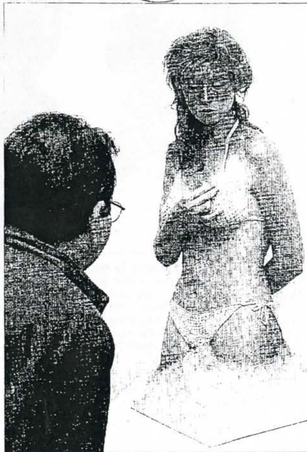
Un visitante mira con curiosidad una de las piezas de la exposición.

SERIE DE INTERCAMBIOS. En La odisea americana estos reexaminan los movimientos artísticos como una serie de intercambios que expresan la que llaman «la crisis del modernismo», un término aplicado en este caso a la realidad artística norteamericana de los años 50-80, en continua búsqueda de lo moderno, así como las estrategias y medios con los que ar-