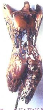
"Diana" 47" x 20" x 11", 2003, unique