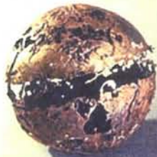
"New World" 34" diameter sphere, 2003, unique